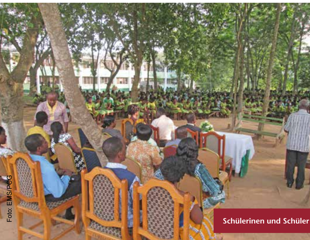
Schülerinnen und Schüler der Akwamuman Senior High School

Der Geschäftsführer für Schulen führt Aufzeichnungen über alle kirchlichen Schulen und Einrichtungen, stellt die Verbindung zwischen dem staatlichen ghanaischen Bildungsdienst und der Kirche her, berät die Kirche in allgemeinen Bildungsfragen und sorgt für die Umsetzung und Bewertung der Bildungspolitik.