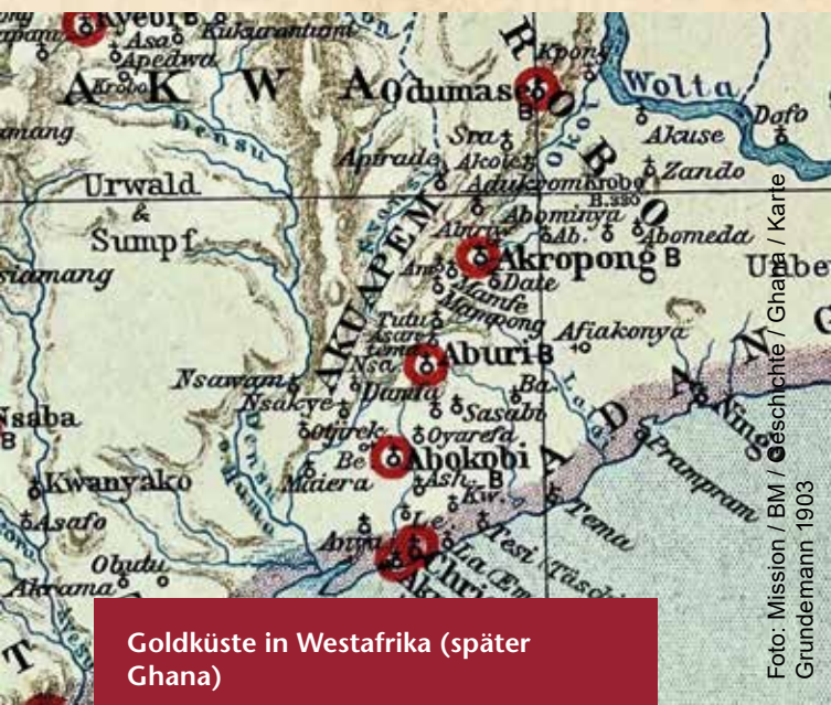
Goldküste in Westafrika (später Ghana)