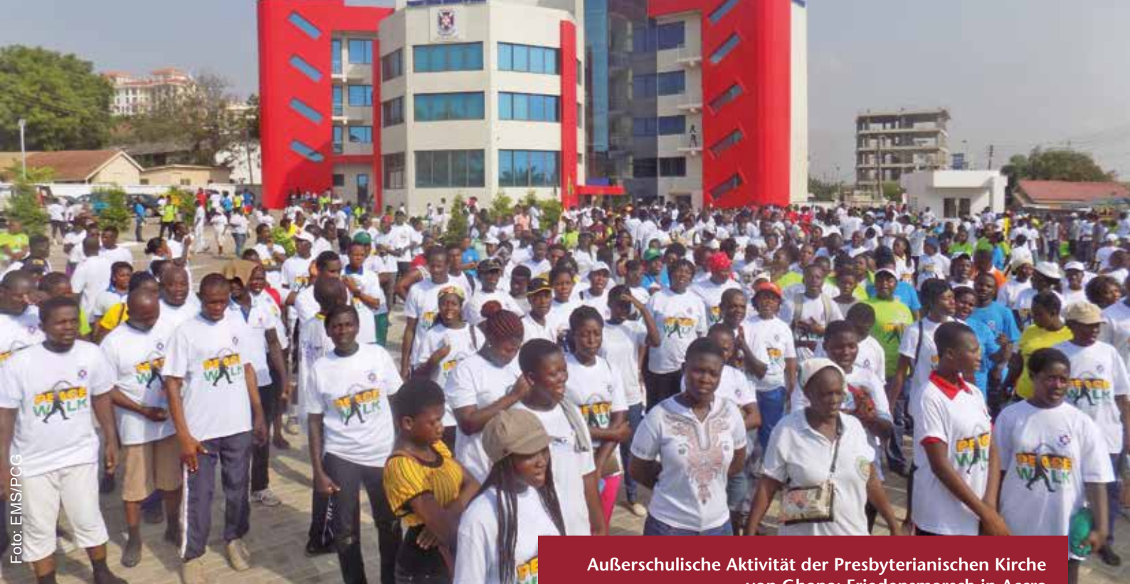
Außerschulische Aktivität der Presbyterianischen Kirche von Ghana: Friedensmarsch in Accra