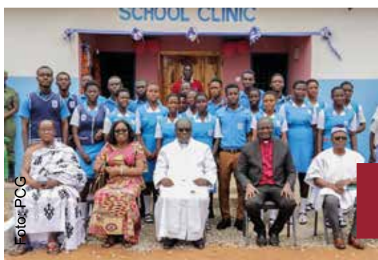
Schulkliniken der Presbyterianischen Kirche in Ghana sollen physische und psychische Gesundheit gewährleisten

Schulkliniken: In diesem Jahr wurden vier Schulkliniken gebaut (Mampong, Techimantia, Adeiso und Nsaba). Der Sinn von Schulkliniken besteht darin, physische und psychische Gesundheit zu gewährleisten. Die Qualität der Bildung in einer Lernsituation wird verbessert, wenn die Lernenden einbezogen werden und sie sich für ihr Lernen verantwortlich fühlen. Dies setzt voraus, dass sie sich gleichzeitig genügend akzeptiert fühlen, um sich voll an Gruppen- und Einzelaktivitäten zu beteiligen (positive Lernumgebung).