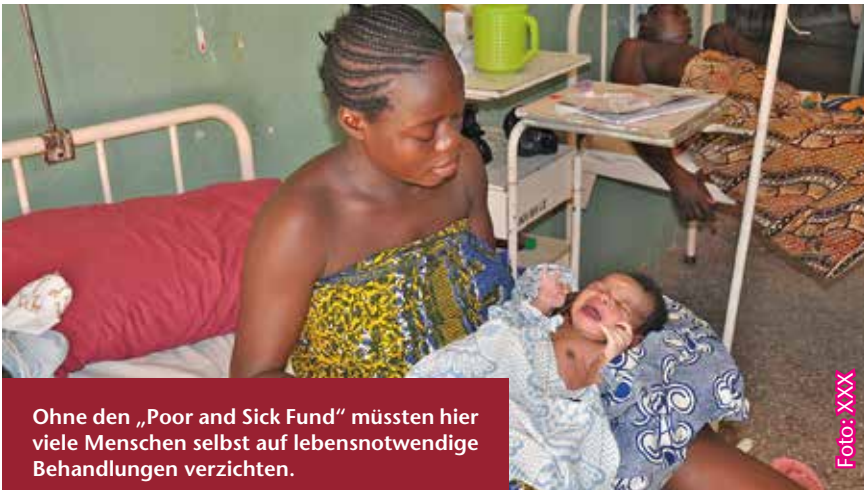
Ohne den „Poor and Sick Fund“ müssten hier viele Menschen selbst auf lebensnotwendige Behandlungen verzichten.

Viele Ghanaer*innen können sich keine ärztliche Hilfe leisten. Unterstützung erhalten arme, kranke Menschen vom „Poor and Sick Fund“ der Presbyterianischen Kirche von Ghana (PCG). Der kirchliche Fonds übernimmt die offenen Kosten, die die Patient*innen nicht selbst zahlen können. Ihren christlichen Auftrag versteht die Kirche dabei ganz praktisch: Menschen in ihren täglichen Nöten zu helfen – mit medizinischer Versorgung, Aufklärung und Vorsorge. Die Kirche betreibt fünf Kreiskrankenhäuser, 27 Gesundheitsstationen, neun Basisgesundheitsdienste und zwei Krankenpflegeschulen.