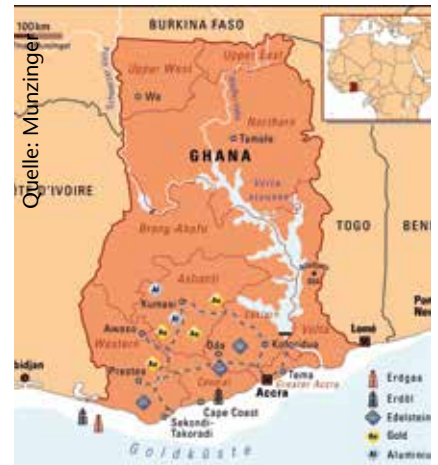
Nahezu die Hälfte der ghanaischen Bevölkerung von rund 34 Millionen ist arm.