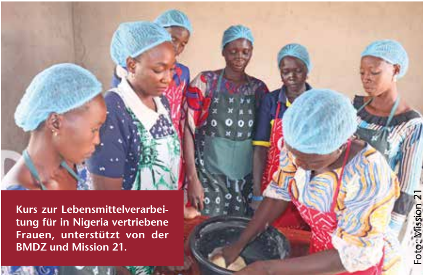
Kurs zur Lebensmittelverarbeitung für in Nigeria vertriebene Frauen, unterstützt von der BMDZ und Mission 21.

Von der Gewalt von Boko Haram und ethnisch-religiösen Konflikte in Nigeria sind besonders Frauen und Mädchen betroffen: Entführungen, Zwangsheirat, sexuelle Gewalt sowie der Verlust von Angehörigen machen sie hochgradig gefährdet. Patriarchale Strukturen und fehlende Bildung führen viele alleinstehende Frauen in Armut und Ausbeutung. Jugendliche sehen kaum Perspektiven. Die Basler Mission – Deutscher Zweig (BMDZ) und Mission 21 fördern Frauen und Jugendliche mit Trainings für Berufs- und Lebenskompetenzen.