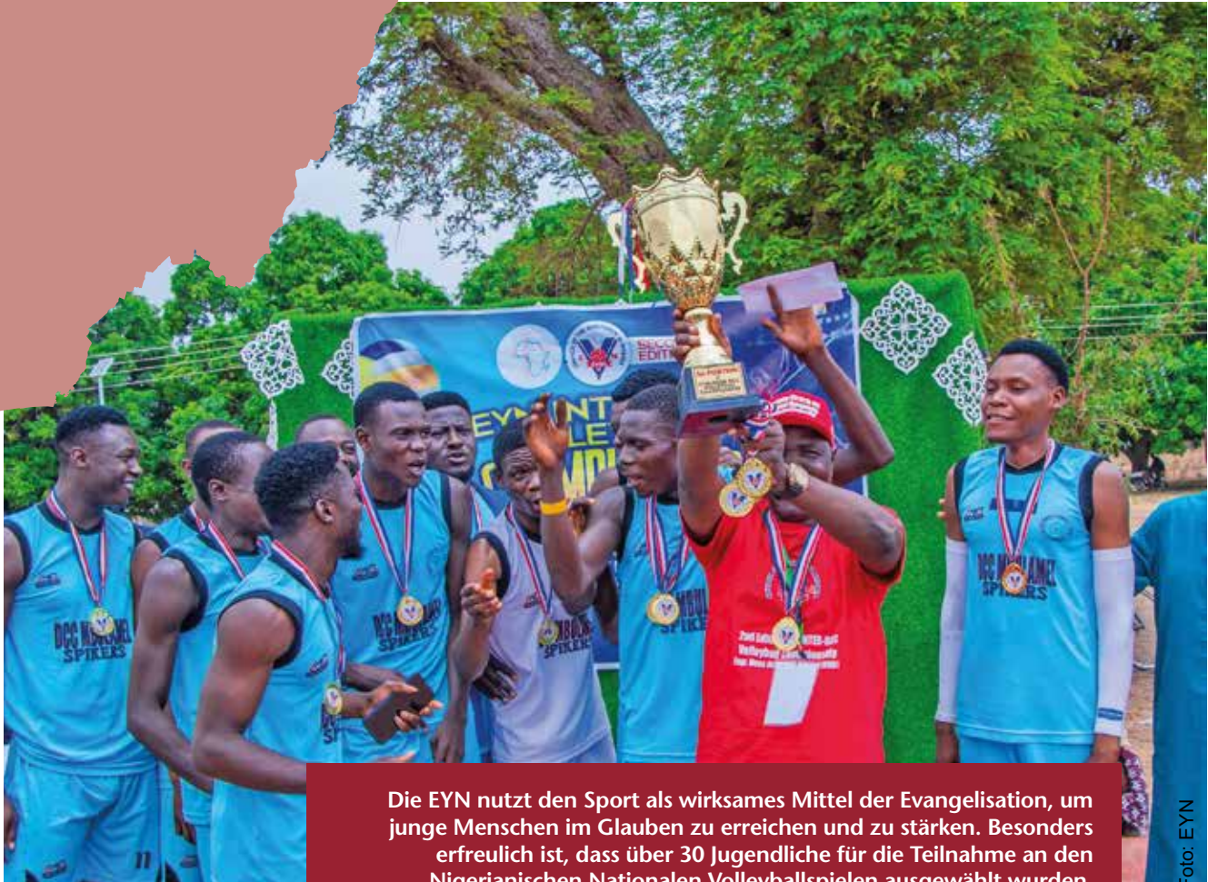
Die EYN nutzt den Sport als wirksames Mittel der Evangelisation, um junge Menschen im Glauben zu erreichen und zu stärken. Besonders erfreulich ist, dass über 30 Jugendliche für die Teilnahme an den Nigerianischen Nationalen Volleyballspielen ausgewählt wurden.