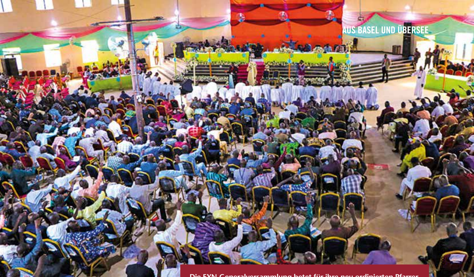
Die EYN-Generalversammlung betet für ihre neu ordinierten Pfarrer.